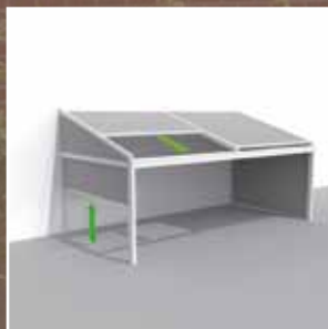
Lagune® + Sidefix = windfeste, verschließbare Seiten