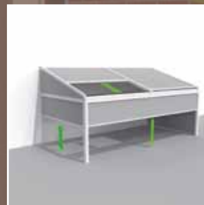
Lagune® + Frontfix + Sidefix = windfeste, verschließbare Vorderseite und Seiten

(Anzahl der Tuchteile des Daches sind abhängig von der Breite der Lagune)