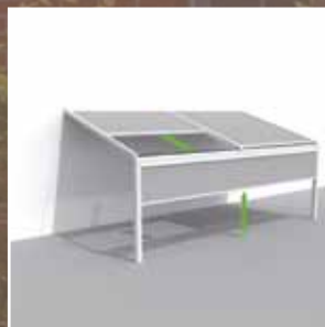
Lagune® + Frontfix = windfeste, verschließbare Vorderseite