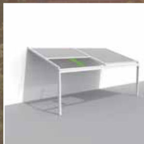
Lagune® = BASIS + Rooffix = Struktur + windfestes, wasserdichtes, lichtdurchlässiges Textilsonnenschutzdach

RENSON® Lagune® ist eine patentierte Aluminiumkonstruktion mit integrierter RENSON® Fixscreen®-Technologie , wodurch alle Screens sehr windfest sind. Das Design ist so entworfen, dass der Sonnenschutz vollständig in der Struktur integriert ist, was zu einer ästhetischen Einheit führt. In Abhängigkeit vom Wetter können Sie die Screens öffnen oder schließen. Auf Grund des modularen Aufbaus ist es einfach, Screens (auch nachträglich) zu integrieren und dabei das schöne Design zu erhalten.